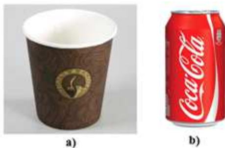
2 pav. Vienkartinis puodelis ir Coca Cola skardinė

Studentams buvo pateikta realiai situacijai artima užduotis. Ji buvo suformuluota taip: „Patobulinti vienkartinį puodelį (2 pav. a) taip, kad 330 ml talpos Coca Cola