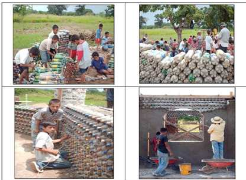
1 pav. Hondūro mokyklos statyba [5].

pasitelkus matematiką? Bent vieną matematinę problemą pabandykite išspręsti patys“ [5].