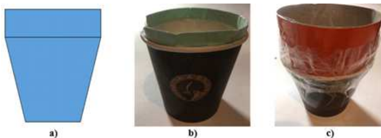
4 pav. Patobulinti puodeliai: a) patobulinto puodelio modelis; b) geriausias patobulinimas; c) blogiausias patobulinimas.

Stebint studentus jų darbo metu pastebėta, kad reali situacija labiau nei „sausa“ uždavinio sąlyga motyvuoja studentus spręsti uždavinius. Be to, dirbant grupėse studentai aktyviai diskutavo vieni su kitais, ginčijosi vienu ar kitu klausimu, o taip ugdomas bendravimas su kolegomis ir bendradarbiavimas dalykiniais klausimais bei skatinamas kūrybiškumas. Dėstytojas tokiu atveju veikia kaip konsultantas, jei iškyla kokių nors klausimų. Tačiau dėstytojui nėra taip paprasta sugalvoti atvejį, kad studentams būtų įdomu ir įgyvendinama.