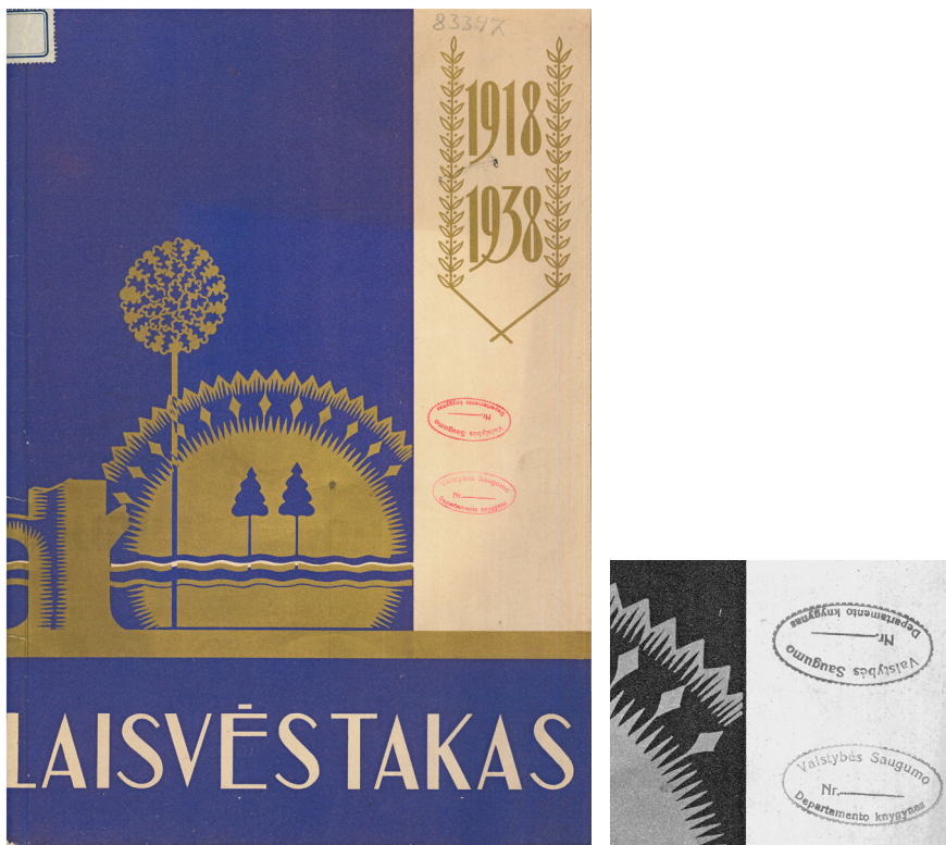
4 PAV. Knygos „Laisvės takas, 1918–1938“ (Kaunas, 1938) viršelis su Valstybės saugumo departamento bibliotekos antspaudu. LNMMB NPDAF. Šifras F1137443/1938.