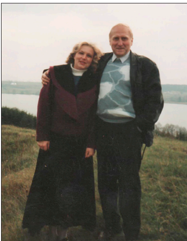
Sodyboje prie Vilkokšnio eže- ro ant Žuklijų piliakalnio