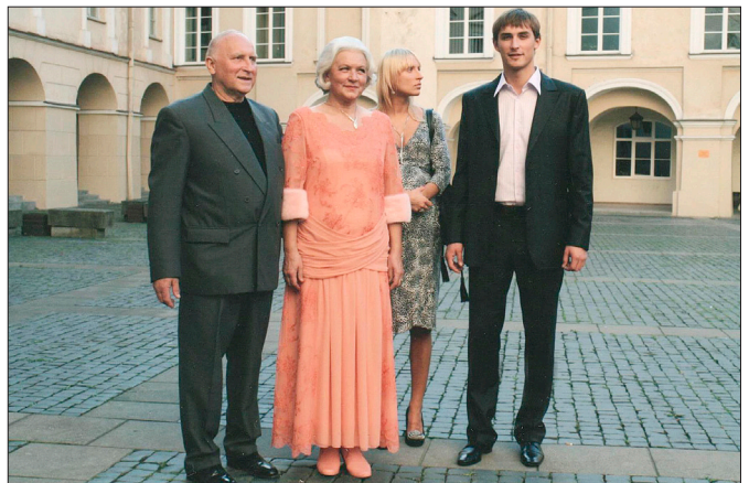
Sūnus Jonas pasirinko tėvo profesiją