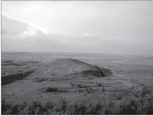
Аркаим, гора Шаманка