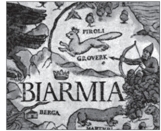
Carta Marina Олафа Магнуса и ее фрагмент (1539)

Все исследователи отмечают, что Биармию «забывают» на более чем сто лет после путешествия в Московию Франческо де Колло (1516–1518), фактически – до сочинений Стралленберга (конец XVII в.). В XIX в. она начинает мелькать в художественной литературе как край мечты и легенды, условная страна скандинавских саг. Так у К. Батюшкова ( Мечта ), так у А. Пушкина – первоначально он собирался отнести место действия своей Русалки к этой же стране: «В лесах Биармии пустынной» (из черновика; Пушкин 1947: 569). В записках путешественников второй половины XIX в. также порой появляется имя Биармия – так называют северо-западные пространства России, в прежние времена населенные чудскими племенами (см. Созина 2012: 420–423). Но расцвет биармийской литературы и пик интереса к этой теме приходится, пожалуй, на наше время, что связано с рядом обстоятельств. К этому мы вернемся чуть позже.