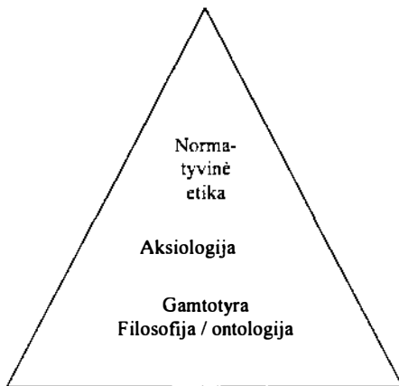
2 pav. Ekologiškos etikos turinio struktūra

Etikai esminis dalykas yra žmogaus savipratas: kuo žmogus save laiko gamtoje ir kokių tiks-