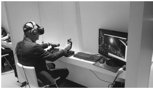
2 pav. Stacionarioji VR, kuri veikia jungiantis prie kompiuterio ar žaidimo pulto

VR yra moderniausia technologiškai pažangi sistema, leidžianti pasinerti į virtualų pasaulį. Vartotojai naudojami įsime namąja VR patirtimi, naudodamiesi visomis technologijomis: VR šalmu, ausinėmis su garsu (muzika), triukšmo mažinimu, garsiakalbiu, vairasvirte bei kitais virtualios aplinkos manipuliavimo ir navigacijos įrenginiais. VR taip pat apima galvos sekimo sistemas, kurios dažnai yra integruotos į šalmą. Šios sistemos seka vartotojo galvos judesius ir sukuria iliuziją, kad juos visiškai supa virtualus pasaulis. Multimodaliniai (regėjimo, klausos, lytėjimo ir uoslės) stimulai prisideda prie faktinio buvimo, panardinimo į virtualų pasaulį jausmo, todėl VR patirtis skiriasi nuo pasyvaus televizoriaus žiūrėjimo ar žaidžiant 2D rankinį vaizdo žaidimą bei žaidimus su valdymo pultu [4].