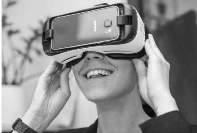
1 pav. Mobilioji VR, kuri veikia naudojant išmaniuosius telefonus