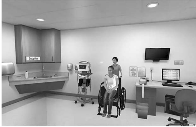
4 pav. Kompiuterizuota VR imitacija

tyrimai prognozuojant rezultatus, pavyzdžiui, poveikį būtinios medicinos pagalbos tarnybai ir jos darbuotojams dėl epidemijų ir kitų nelaimių, keičiančių pacientų srautą. Taigi VR gali padėti parengti skubiosios medicinos pagalbos darbuotojus, kai susidaro ekstremali situacija [12].